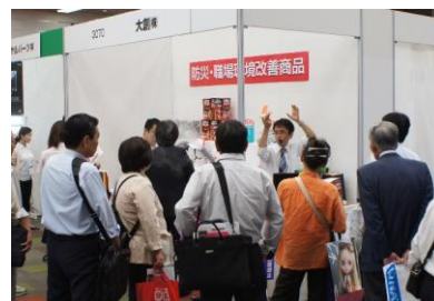
※前回（2011年9月）の大阪ギフト・ショー会場の様子