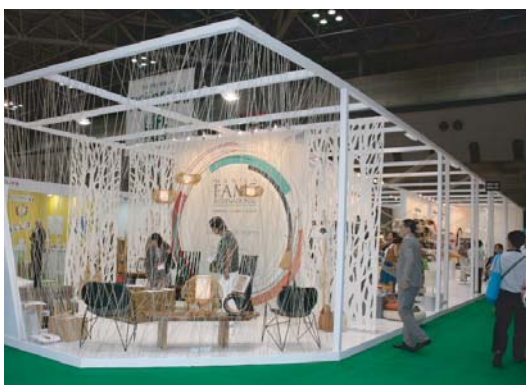
審査員特別賞のブース