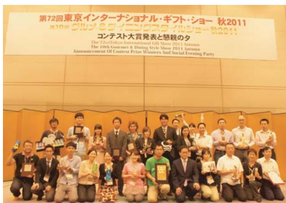
受賞企業の皆様で記念撮影