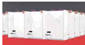
▲Type-Aレイアウトイメージ