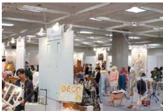
※展示風景 (参考画像)

※パネルには画鋏、若年性の両面テープ使用可能。 ※ライトやコンセントなど有料のレンタル備品もございます。