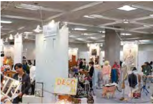
※展示風景 (参考画像)

※パネルには画鋏、弱粘着の両面テープ使用可能。 ※ライトやコンセントなど有料のレンタル備品もございます。