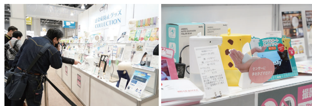
前回(2021年2月)開催した特別展示イベント「感染防止グッズCOLLECTION」の様子

除“防灾”“防盗”“防疫”展区“3防产品展区”外, 以东京礼品展全体参展公司为对象的“特别展示活动”PROTECT YOUR LIFE”- 3防产品展示”将在西2厅入口旁(预定)举行。也请期待。