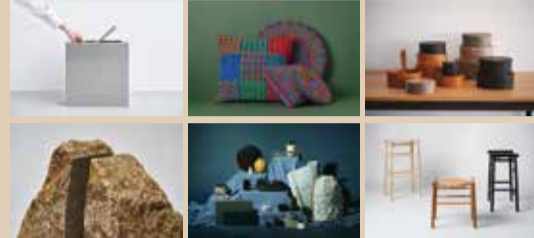
左上から時計回りに EXTLINE / 現代工業、EETY studio、IFUJI、TGDP (Takasu Gaku Design Products)、F-TRAD、AJI PROJECT

「FOCAL POINT」は、焦点・(話題や活動などの)中心を意味します。3回目となる今回のコンセプトは「Connections in Color」。交差して広がる黄色のグリッドは、会場全体にすこやかな明るさと秩序を生み出します。出展社の輪郭を際立たせ、人が自然に集まり、心地よくコミュニケーションできる、鮮やかな交流の中心地にご期待ください。